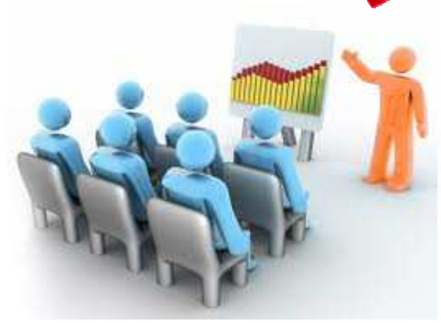
Σεμινάρια - Εκδηλώσεις